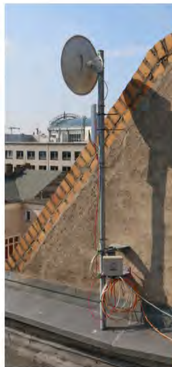
Vergleichbare Installation mit zwei Antennen