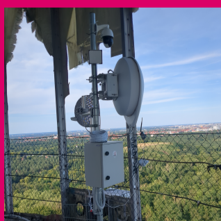
Mast mit Antennen in Richtung Osten