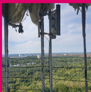
Mast mit Antennen in Richtung Norden