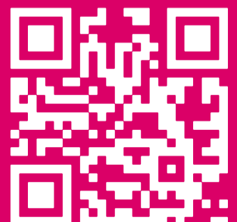
Mehr infos auf: ff.berlin/teufelsberg-core